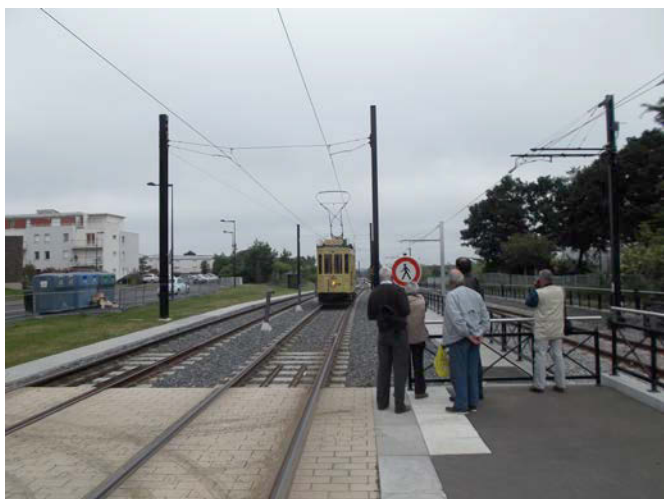
Motrice 144 Station Ranzay. (à droite la voie de Châteaubriant)

Partis du dépôt de Dalby et après avoir traversé la machine à laver les rames, nous avons gagné la Haluchère puis le terminus de Ranzay. Après demi-tour, nous avons parcouru la ligne 1 jusqu'à son terminus de Jamet (en traversant à nouveau la machine à laver du dépôt de Dalby car la 144 ne passe pas sous la passerelle située après la station Dalby). Après un nouveau demi-tour, nous avons regagné le dépôt en fin de matinée.