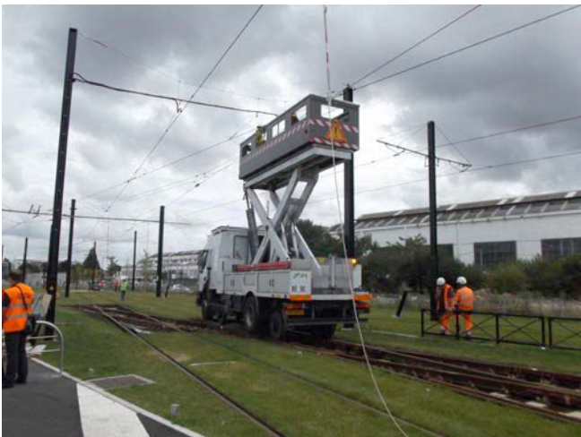
Contrôle des caténaires