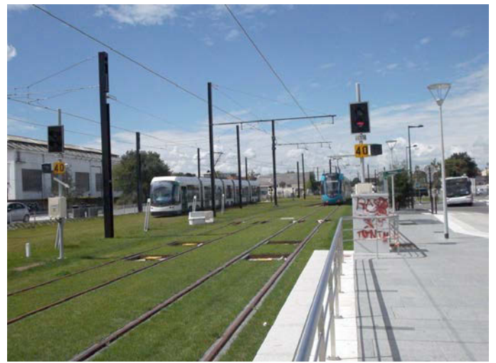
Protection du croisement et compteur d'essieux