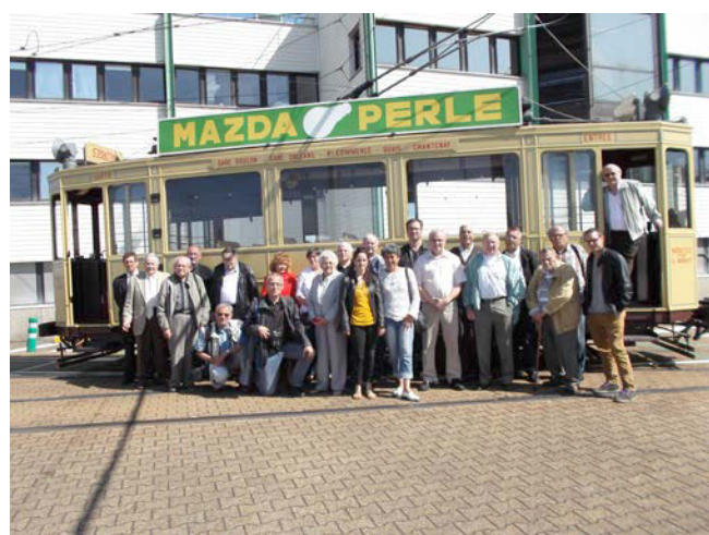
Au dépôt de Dalby