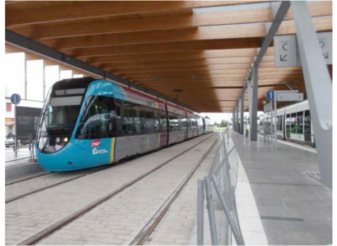
Tram-train UM 2 (rames 102 & 104)