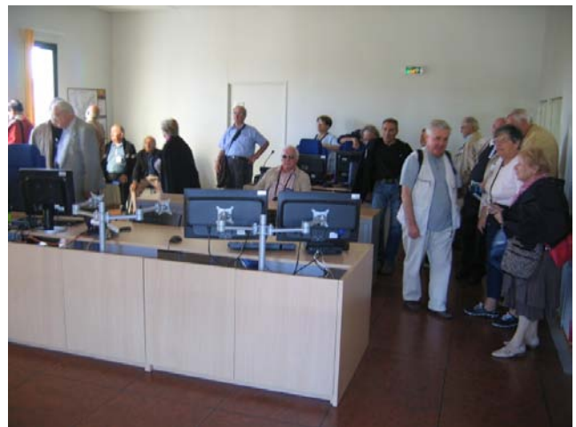
PC de secours , tous écrans éteints.

Ce fut une visite très intéressante et commentée avec beaucoup de précisions par notre guide très chaleureux et qui répondait avec enthousiasme à toutes les questions qui lui étaient posées.