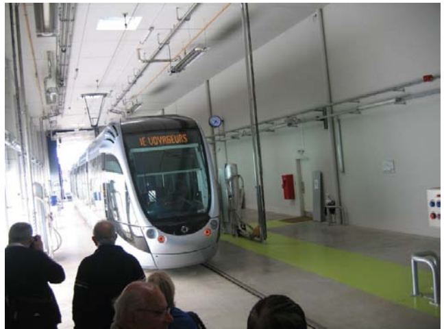
Explications sur le stockage et le remplissage des réservoirs de sable.

Dans les locaux réservés à la partie administrative nous avons observé le P.C. du site. Il existe également un P.C. concernant tout le réseau tram actuellement inutilisé mais qui peut être immédiatement opérationnel en cas de défaillance du P.C. de Campus -Trafic qui gère tout le réseau de transport bus et tram de la ville.