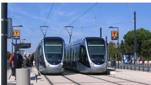
Terminus Aéroconstellation , rames au départ

Le trajet Arènes-Aéroconstellation où se situent les ateliers de Garossos fut une découverte pour ceux d'entre nous qui n'avaient jamais emprunté le tram.