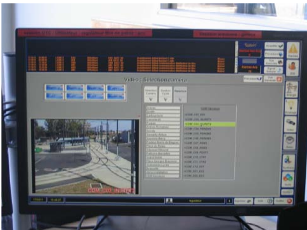
Un écran du PC du site

Dans les locaux réservés à la partie administrative nous avons observé le P.C. du site. Il existe également un P.C. concernant tout le réseau tram actuellement inutilisé mais qui peut être immédiatement opérationnel en cas de défaillance du P.C. de Campus -Trafic qui gère tout le réseau de transport bus et tram de la ville.