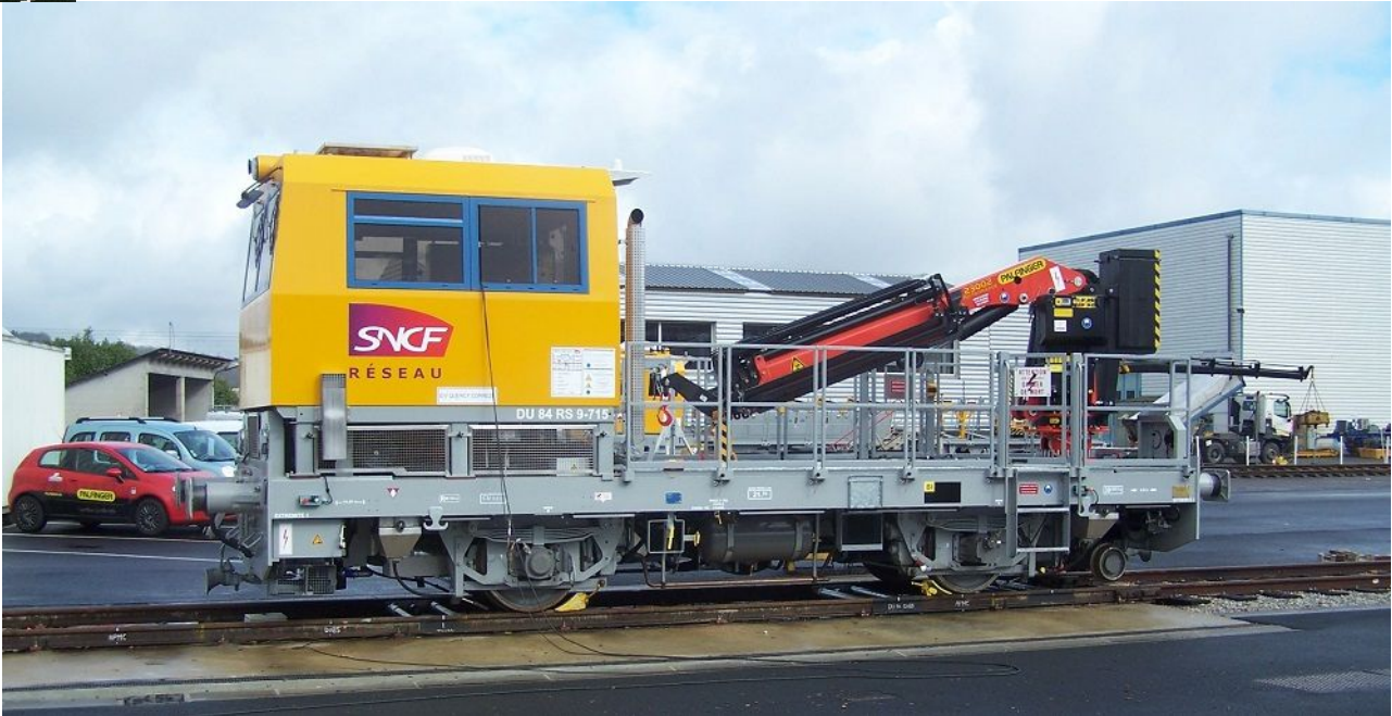
Draisine DU84 équipée d'une grue

Adresse du Président : Michel FOURMENT – cidex 3592 – 6, rue des Fauvettes - 31840 AUSSONNE - Téléphone : 05 61 85 12 56 - Portable : 06 37 17 30 98 - Mail : fourmentmichel@wanadoo.fr Secrétaire-comptable : Christiane GRANEL 1, rue Charles Baudelaire 31200 TOULOUSE – tel : 05 61 13 43 01 – Mail : christiane.granel@orange.fr