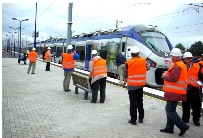
Une rame Régiolis démarre de Vendenheim en direction de Strasbourg