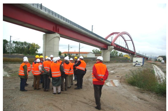
Le groupe devant le Bow-String