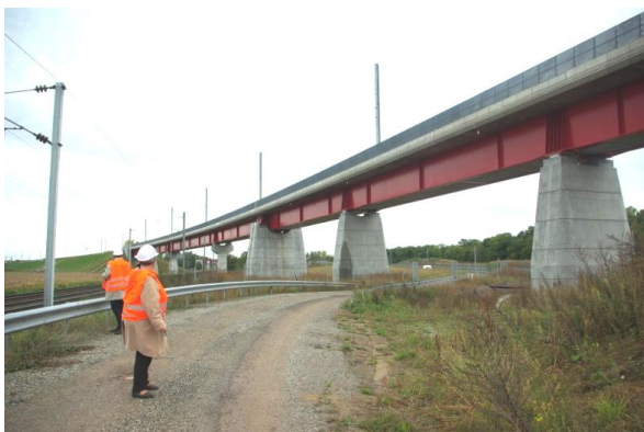
Ouvrage de franchissement des voies de la ligne actuelle Paris et Metz-Strasbourg

Un ouvrage de type "Bow-String" permettra à la voie LGV direction Paris de franchir la voie LGV direction Strasbourg ainsi que la voie de circulation des trains venant d'Haguenau. C'est par cet ouvrage que les TGV aborderont Strasbourg en circulant à droite (comme sur toutes les lignes de l'ancien réseau Alsace-Lorraine) alors que sur l'ensemble de la LGV-EST, les trains circuleront à gauche.