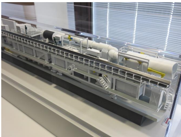
Maquette du tunnelier

Le groupe a été accueilli à la maison de l'information située à Saint Jean Saverne. Deux films permettant d'avoir une présentation globale du projet ont été projetés. Des explications techniques orales complétaient les projections. Une salle d'exposition comportant notamment la maquette du tunnelier ayant foré les deux tubes du tunnel de Saverne. Chaque tube terminé a une longueur de 4200m et un diamètre intérieur de 8,90m.