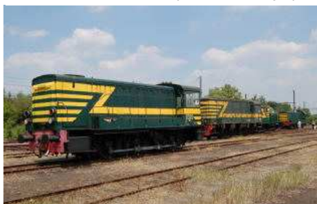
26 juin 2010. Les 175 ans des chemins de fer belges. Présentation de la collection de locotracteurs belges préservés par le PFT basé à St Ghislain.