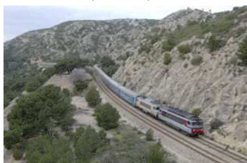
27 mars 2010 - MEJEAN - TEOZ Bordeaux - Nice détourné par la Côte Bleue avec renfort d'une BB 67400.