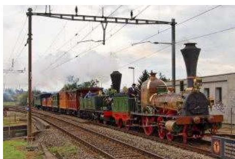
25 septembre 2010. Les 150 ans de l'arc Jurassien. La "LIMMAT" et la "SPANISCH BROTLI BAHN". (Le train des boulangers)