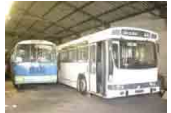
Le PAK 50 de 1966 et le PR 100 de 1976