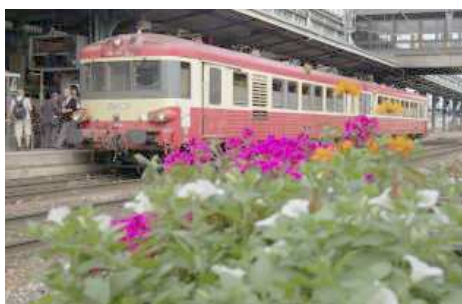
Lyon Perrache 29 mai. Voie J. Fin de la boucle d'au revoir aux Caravelles de l'ouest-lyonnais ... avec quelques fleurs.