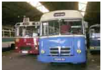
Le PH 100 et le PLR de 1961 ex service transport des usines Berliet.