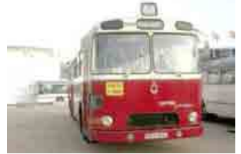
Le PH 100 N° 2502 de 1964 ex TCL (en service à Lyon de 1964 à 1978/79)