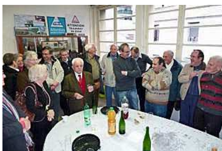
Notre président d'honneur répond au nom de tous avec son habituel humour !