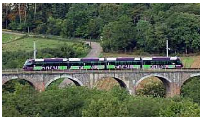
Ouest-lyonnais: → Campagne d'essais du Tram Train. Entre St Paul et L'Arbresle, rame pelliculée sur le viaduc de Lentilly.