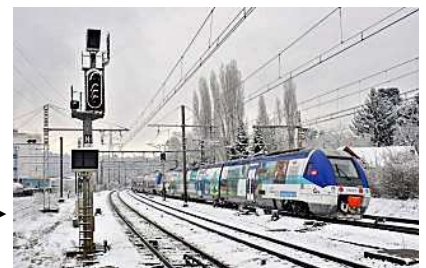
▲ Collonges-Fontaine TER Clermont-Lyon, le 31.01.2012 Lozère, courbe de l'Altaret. TER Nîmes - Mende, le 31.01.2012 ▼