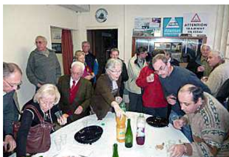
La dégustation se fait avec plaisir et chacun apprécie.