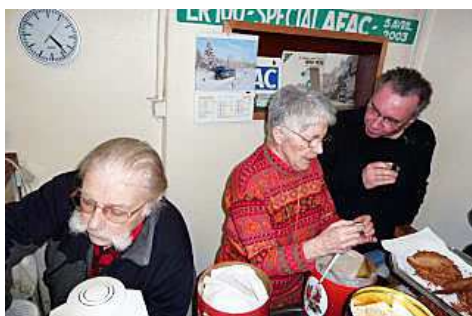
Ce moment de convivialité nécessite quelques préparatifs. On s'active !