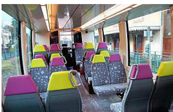
Intérieur coloré du Tram Train

assurés en Tram Train dès octobre mais cela n'est pas encore défini.