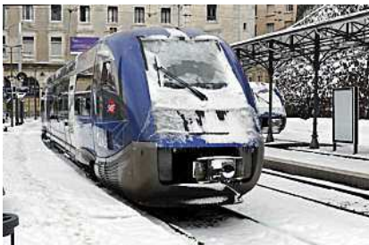
▲ Lyon St Paul 73500 le 09.01.2010 Seysssel-Corbonnod ZGC le 07.01.2010 ▼