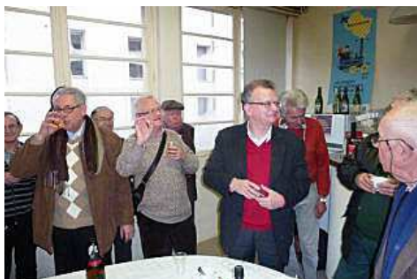
Le président souligne l'importance de la tradition amicale de cette journée.