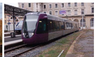
Tram Train 209 (U 52517/52518) en livrée TER à Lyon St Paul .