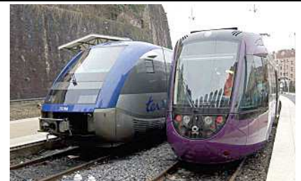
Tram Train et ATER se côtoient à Lyon St Paul.

Le passage au prochain service en décembre 2012 devrait donc voir la mise en service commercial du Tram Train sur les 2 relations St Paul – Sain Bel et Brignais. Il n'est pas impossible que certains TER soient