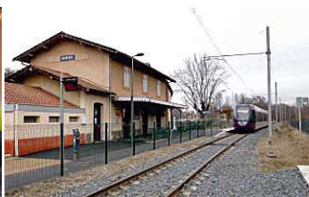
Tram Train 209 (U 52517/52518) en livrée TER à Sain Bel devant l'ex BV qui a abrité une AG de l'AFAC RA.