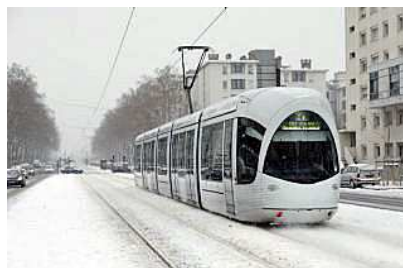
▲ Lyon T4 boulevard des États Unis le 09.01.2010 Lozère, plateau du Larzalier. Ligne La Bastide-Mende. TER Nîmes -Mende, le 31.01.2012 ▼