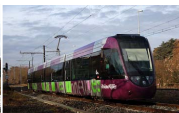
Tram Train 206 (U 52511/52512) pelliculé Rhône Alpes quitte Écully