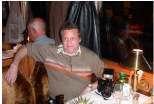
Entre Coire et Arosa le 25 septembre 2005