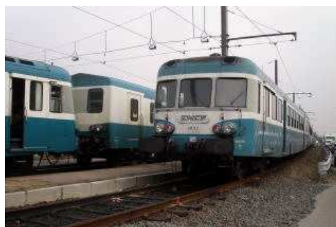
X 2852 à la Scaronne en janvier 2006

Les nombreuses îlons, ces bras délaissés du Rhône, qui sillonnaient tout le quartier se nommaient en fonction de leur importance, la petite Mouche, la Mouche, la Grosse Mouche. Ces ruisseaux ont d'ailleurs laissé leur nom au quartier, ainsi qu'aux bateaux-mouches qui y furent construits, et dont une trentaine d'exemplaires firent leur entrée dans la capitale à l'occasion de l'Exposition Universelle de 1867. Le terme est resté pour désigner les bateaux de promenade sur la Seine.