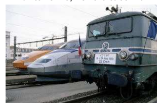
Scaronne le 20 septembre 1998: trois détentrices de record du monde.