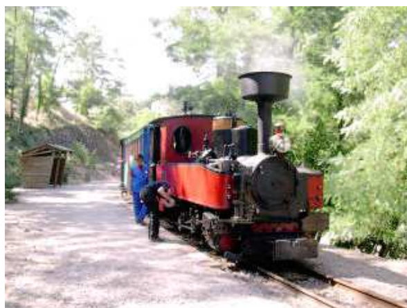
Locomotive Henschel & Sohn de 1917 (Voie de 60) du Chemin de Fer des Combes.