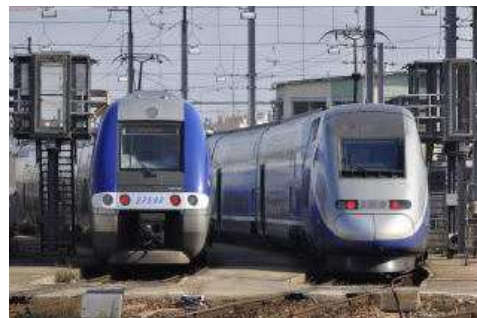
Scaronne février 2009 Z 27592 et TGV 285