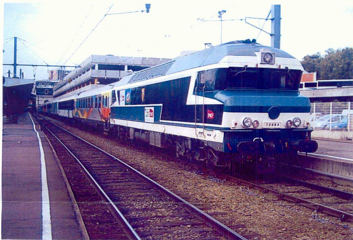
Le train du rugby en gare de TOULOUSE MATABIAU